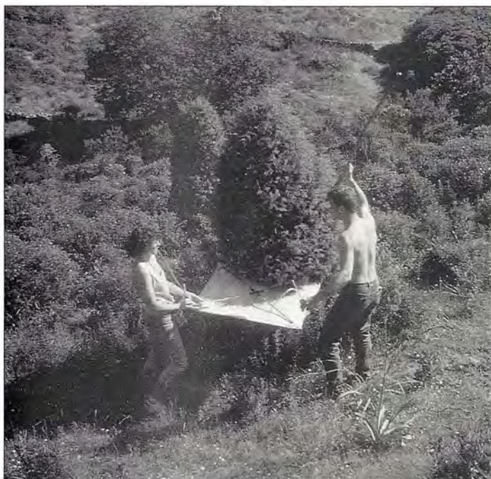
■ Séance de battage à Scandola, dans un maquis dégarni par places, impénétrable ailleurs..

récolte remonte à 1874 ! (une femelle à Calvi) ; deux mâles de Spermophora simoni , Pholcide récemment décrit (1973) sur des exemplaires de collection étiquetés "France méridionale".