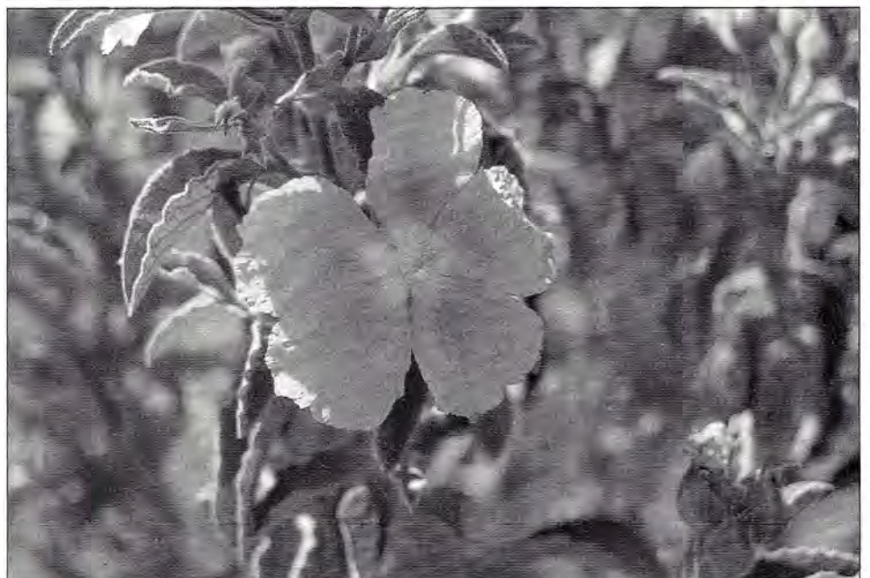
■ Cistus albidus , (Cistacée) très abondant ; ses corolles éphémères sont le refuge de très nombreux insectes floricoles. (Cliché G. Tiberghien).

Une fois le séjour sur les îlots sud achevé, la route du retour passe par Bonifacio (BO) et ses calcaires mio-pliocènes. Ceci permet d'observer une flore inhabituelle au reste du voyage : Lavatère, Astragales, Chrysanthème à couronne, Gesse pâle, Réséda, Ail rose, Calycotome villex, Genévriers de Phénicie, Daucus cf. gingidium ,... De même, les abords de la ville comme les environs, Pertusato (P), se montrent généreux en Coléoptères (Ténébrionides, Harpales , Camptocelia , Percus , Triodont , phytophages, Coccinellides,...), Hyménoptères, Lépidoptères, Araignées lapidicoles, avec de très nombreuses Gnaphosides ( Zelotes