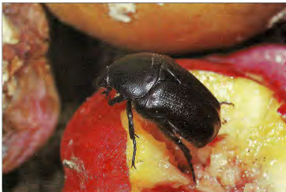
■ Netocia sardoa , cétonie endémique cyrno-sarde se trouve le plus souvent profondément enfoncée dans les capitules des grands chardons.

Galéria sera aussi le point de départ de circuits en montagne cristalline. La région accidentée et déjà bien boisée d' Evisa (E) et des gorges de la Spelunca (GS) nous permet d'accroître surtout en clairières ou près du Tavillela, nos listes d'Odonates (5 taxons dont Ceriagrion et peut-être le rare Paragomphus genei !), de Lépidoptères ( Pontia , Euchloe insularis , Lycènes...), d'Hyménoptères prédateurs, de Coléoptères (parmi les coprophages, Thorectes geminatus , et des centaines de Sisyphus ) et d'Aranéides ; sur les arbustes et les génévriers nous rencontrons l'étonnante Thérédide Phorontia paradoxa , toute hérissée de tubercules. L'impressionnante forêt d' Aitone (A) aux pins Laricio géants apporte sa contribution à la faune supraméditerranéenne montagnarde ; il s'agit notamment de Carabidés (dont l'Harpale corso-sarde H. bellieri ), de xylo-