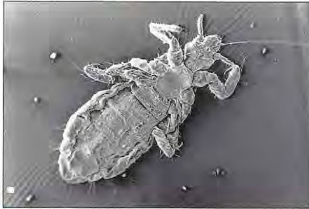
Pediculus humanus Linné 1758. Adulte

Afin de pouvoir procéder aux tests de validation de nouveaux produits, il est indispensable de disposer d'un élevage de poux. Pour obtenir un élevage de qualité, les conditions expérimentales doivent reproduire au mieux l'environnement naturel de l'insecte : 28°C et 80% d'humidité relative.