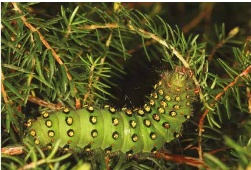
Petit Paon de nuit Saturnia pavonia (Lép. Saturnidé) sur bruyère, Cast (Finistère), juillet 2014