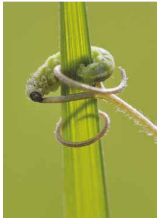
Cette gracieuse chenille verte a été photographiée à Bono (Morbihan) en avril 2010. Nous ne sommes pas parvenus à l'identifier... Vous avez une suggestion ? Merci de l'adresser à la rédaction via portfolio@insectes.org !