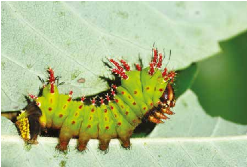
Eacles masoni fulvaster (Lép. Saturnidé), de Guyane française (photographié en élevage), août 2014.