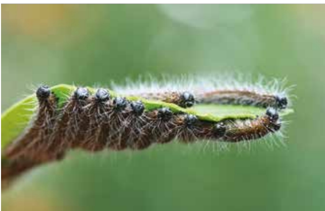
Delias ellipsis (Lép. Piéridé), Nouméa (Nouvelle-Calédonie) sur feuille d' Amyema scandens (Loranthacées), septembre 2009