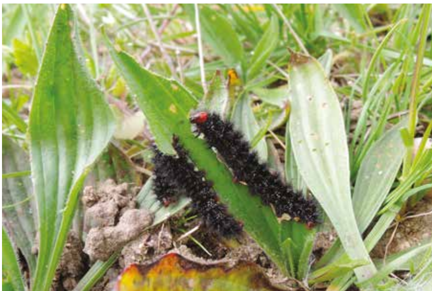
Mélitée du plantain Melitaea cinxia (Lép. Nymphalidé) sur plantain lancéolé, Drôme, avril 2015