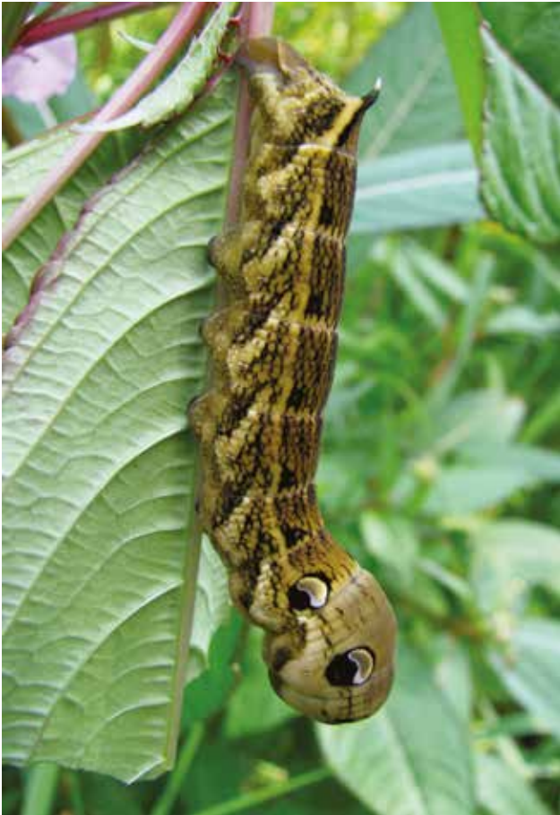
Sphinx de la vigne Deilephila elpenor (Lép. Spingidé), sur balsamine de l'Himalaya. Montfermy-la-Sioule (Puy-de-Dôme), août 2010