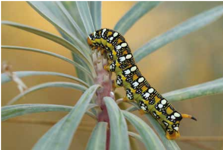
Sphinx de l'euphorbe Hyles euphorbiae (Lép. Sphingidé), sur euphorbe arborescente, Villeneuve-lès-Maguelone (Hérault), septembre 2017