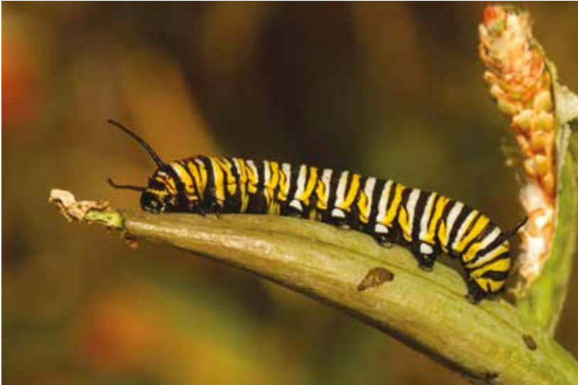
Monarque d'Amérique Danaus plexippus (Lép. Nymphalidé), Maspalomas, Grande Canarie (Espagne), décembre 2018.