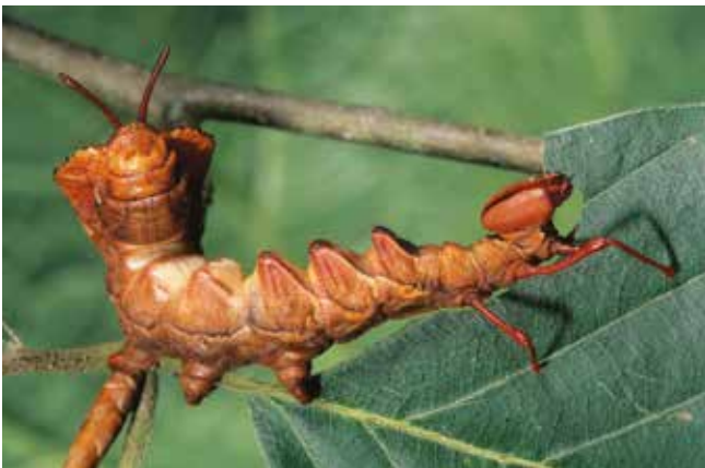
Écureuil Stauropus fagi (Lép. Notodontidé), Pacé (Ille-et-Vilaine) sur feuille de hêtre, Finistère, 2005.