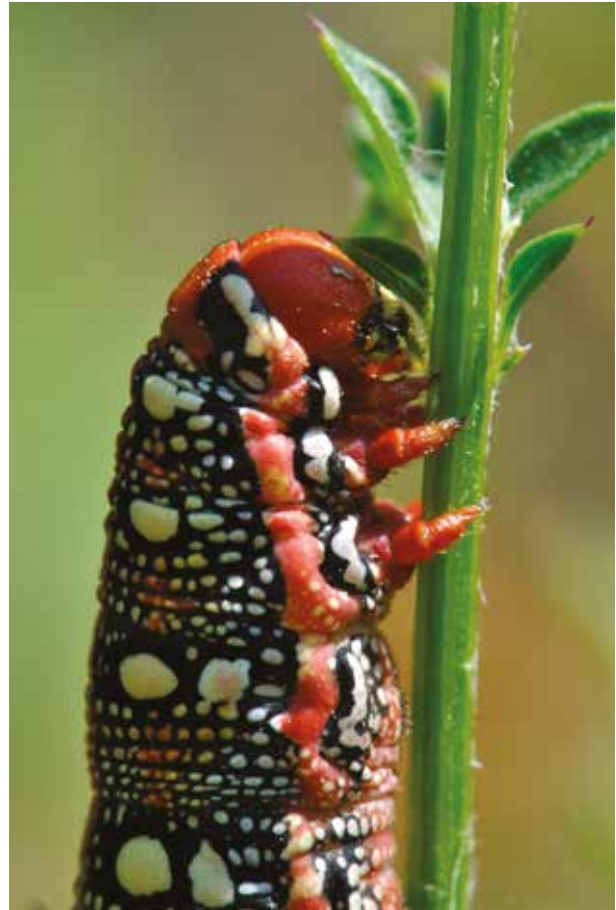
Sphinx de l'euphorbe Hyles euphorbiae (Lép. Spingidé), Béthisy-Saint-Pierre (Oise), juillet 2018