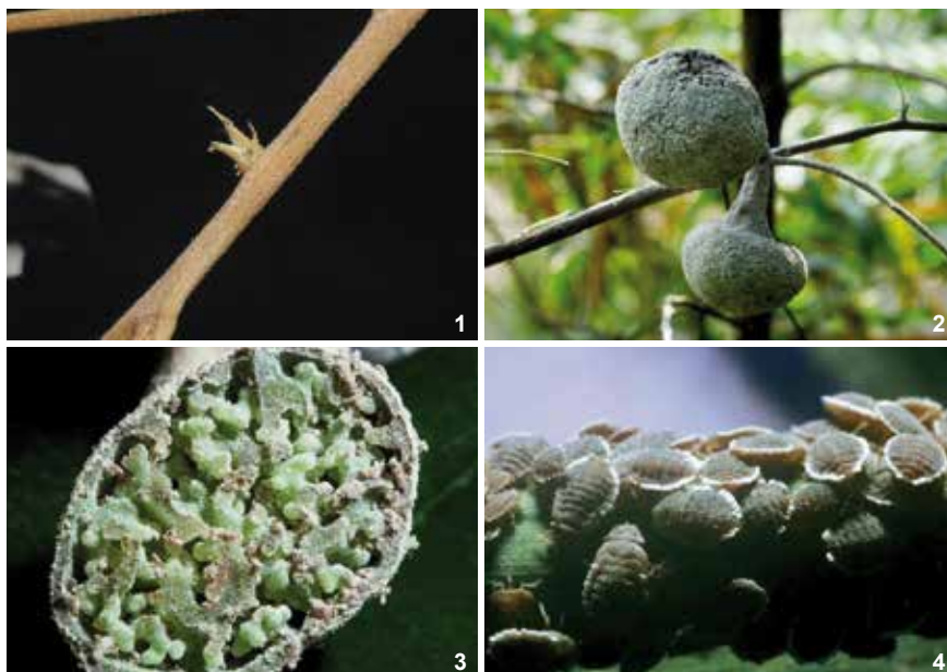
1. Très jeune galle de Ceratoglyphina styracicola en formation sur benjoin. 2. Galle à maturité, avec 2 lobes. 3. Un des lobes en coupe montrant le réseau ramifié de tissus sur lequel les pucerons se nourrissent. 4. Colonie de C. styracicola sur leur hôte secondaire - Clichés : Shigeyuki Aoki and Utako Kurosu, "A Review of the Biology of Cerataphidini (Hemiptera, Aphididae, Hormaphidinae), Focusing Mainly on Their Life Cycles, Gall Formation, and Soldiers," Psyche , vol. 2010. En ligne à : https://www.hindawi.com/journals/psyche/2010/380351/

On a étudié des cas de compétition (intraspécifique) entre fondatrices pour un lieu convoité, dont l'occupation détermine le succès reproducteur. Elles se battent entre elles 3 . Entre espèces différentes, en revanche, la compétition est peu