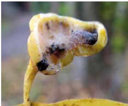
Larve de Syrphidé dans une galle ouverte de Pemphigus sp. - Cliché Gilles Carcassès à https://natureenvilleacergyponoise.wordpress.com/