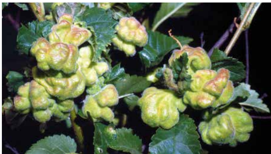
Galles du Puceron de l'orme et du poirier

Adelges laricis est le Chermès de l'épicéa et du mélèze (alias Chermès des aiguilles de mélèze), responsable de galles en ananas à l'extrémité des pousses de la première essence, son hôte primaire. Les sexués pondent sur les bourgeons du mélèze et la fondatrice apparaît en août. Les fondatrices, qui se repèrent à une abondante sécrétion cireuse, hivernent à la base du bourgeon puis, au printemps, déclenchent la formation de la cécidie. Les migrants ailés en sortent vers juillet et gagnent le mélèze tandis que la colonie continue de