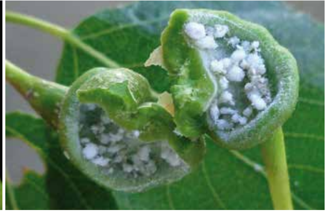
Galles de Pemphigus spyrothecae sur pétioles de peuplier - À droite : idem, galle ouverte

larves de 1 er et 2 e stades, à la cuticule durcie et munies de pattes plus épaisses ou d'une paire de cornes. Ils réagissent contre les intrus, œufs ou larves de parasitoïdes, prédateurs généralistes, comme aux pointes des pinces de l'entomologiste, en s'y agrippant ou en les piquant (les doigts de l'entomologiste le ressentent très fort). Les jeunes larves, en plus, ont en charge le ménage : elles roulent dehors par le pertuis de la galle les gouttes de miellat enrobées de cire et jettent les exuvies. Chez Pemphigus spyrothecae (Ériosomatidé, galle en spirale sur le pétiole des feuilles de peuplier), les ménagères (1 er stade, aux grosses pattes) gardent l'entrée et réparent les trous éventuels ; avec leur caste de soldats, les « pemphi-giens » sont considérés comme eusociaux.