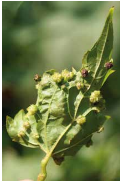
Galles du phylloxera de la vigne à la face inférieure d'une feuille de vigne

États-Unis où il accomplit son cycle complet sur la vigne des rivages Vitis riparia . L'œuf d'hiver est pondue sur le tronc. Au printemps les fondatrigenes gagnent les feuilles, y provoquant des galles en forme de pustules, qui sont dommageables pour le pied infesté. S'y succèdent plusieurs générations. Des larves migrent sur les racines ; de nouvelles générations plus tard, les sexupares engendrent les sexués. Le cycle, annuel, recommence. Sur les vignes européennes, le Phylloxera n'accomplit pas son cycle