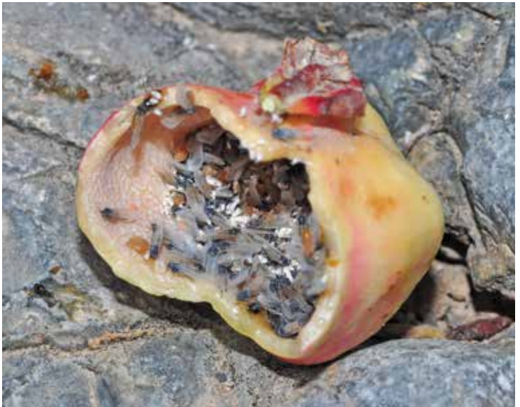
Galles de Baizongia pistaciae

cia (pistachier) ; les Phylloxéridés sur Quercus (chêne), Carya (paccanier) et Vitis (vigne) ; les Adelgidés sont inféodés aux conifères.