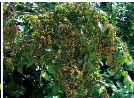
Galles du Puceron des feuilles de l'orme.

se développer sur l'épicéa. Leurs filles hivernent sur les rameaux et reprennent leur développement au printemps. En cas de pullulation, l'arbre peut souffrir. Sur épicéa, les