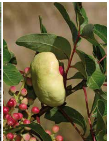
Galles en bourse arrondie de Geocica utricularia à la base des folioles de Pistacia terebinthus (taille de 2 à 2,5 cm)