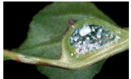
Galle ouverte de Pemphigus bursarius sur un pétiole de peuplier - Cliché Remi Coutin-OPIE

Les galles, récoltées dans la nature, sont mises à sécher et les habitants plongés dans l'alcool. Pour la collection, le mieux est de présenter les spécimens botaniques piqués dans une boîte à insectes (qui peut être vitrée) juxtaposés à un petit tube contenant les pucerons. Ceux-ci peuvent aussi être montés entre lame et lamelle, inclus dans une résine. Les parasitoïdes (recueillis surtout après séjour en éclosoir) et inquilins éventuels sont à mettre à côté.