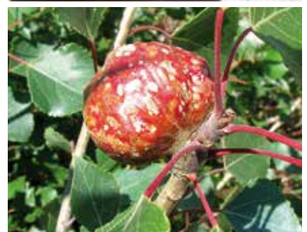
Galle de Pemphigus sp., probablement P. immunis , sur peuplier noir. Les euphorbes sont l'hôte secondaire de ce puceron. Il en parasite les racines pendant la mauvaise saison