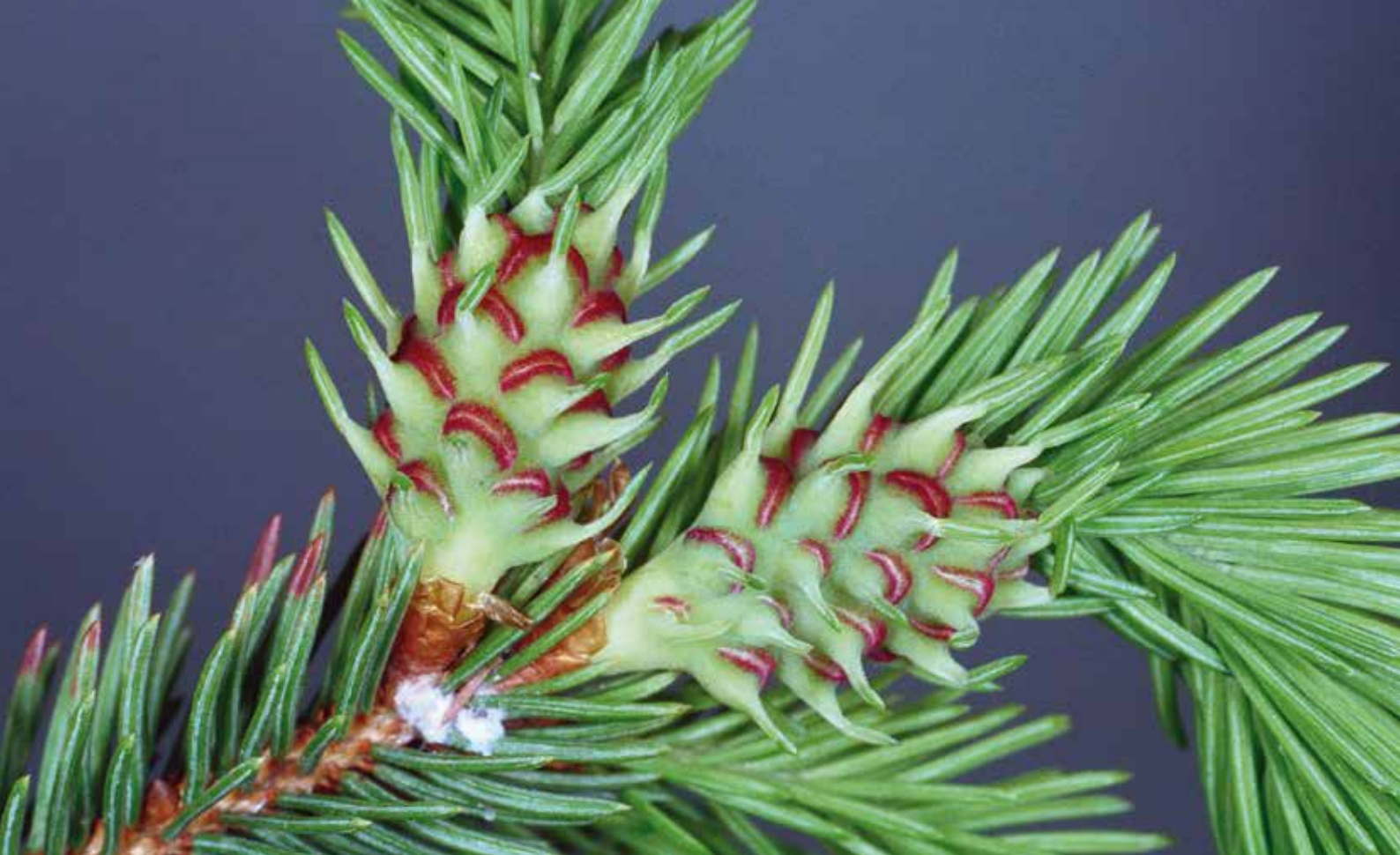
Galles nouvellement formées du Chermès de l'épicéa