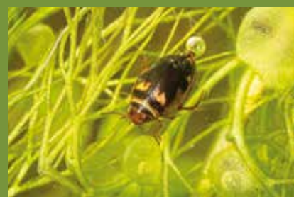
Hygrotus inaequalis