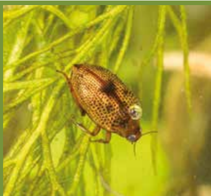
Peltodytes caesus (Halipplidé)