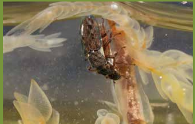
Accouplement d' Hydrochus augustatus (Hydrochidés)