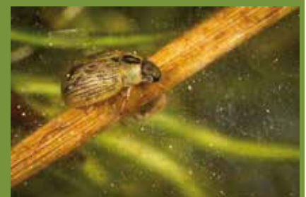
Berosus signaticollis