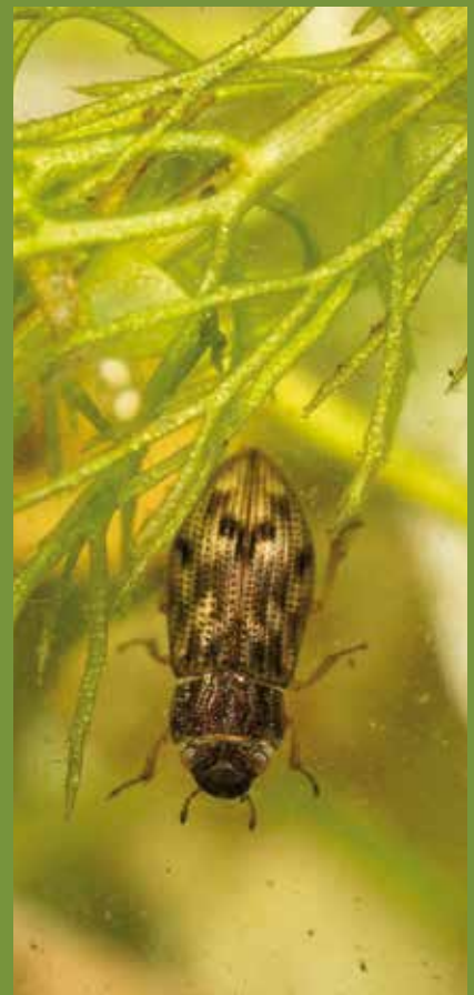
Helophorus sp. (Hélophoridé)

Proches des Hydrophilidés, les Hélophoridés constituent une famille dont l'identification des espèces nécessite la dissection. Ces Coléoptères sont de mauvais nageurs et se tiennent plutôt dans la végétation aquatique. Très commun, Helophorus grandis est la plus grande espèce du genre en Basse-Normandie. Un peu plus du tiers des