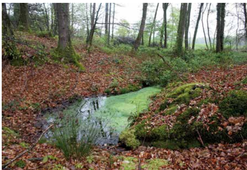
Gouille forestière (Rouellé, Orne)

Trois phases complémentaires ont permis d'aboutir à l'élaboration de l'IcoCAM : la mise en place d'un protocole d'échantillonnage standardisé, la constitution d'un référentiel des mares de Basse-Normandie, l'analyse et l'exploitation statistique des données collectées. Le protocole d'échantillonnage – réalisé majoritairement avec un troubleau suivant une approche chronométrée, relative à la surface de la mare et à la représentativité des mésohabitats présents – comprend deux passages par mare (printemps et automne). Chaque site prospecté est décrit sur la base d'une trentaine de paramètres (taille, profondeur, contexte, berges, etc.). Le tri est fait sur place