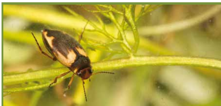
Hydroporus palustris