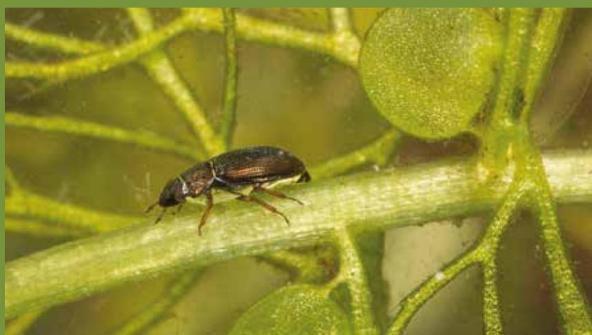
Ochthebius minimus (Hydraénidé)

Les Hydraénidés sont rangés parmi les espèces semi-aquatiques car leurs larves sont terrestres. Toutes les espèces vivant en France (107/16) sont de taille très réduite et souvent très spécialisées. Hormis cette famille, dans le cadre de cette étude, les espèces semi-aquatiques n'ont pas été prises en compte (Scirtidés, Chrysomélidés, Curculionidés), la méthode d'échantillonnage n'étant pas adaptée. ■