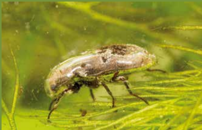
Dryops sp. (Dryopidé) recouvert d'une bulle d'air

Les Hydrochidés constituent une petite famille (9/7). De petite taille (3 ou 4 mm), ils ont une forme allongée très caractéristique et présentent souvent des reflets métalliques. Ces marcheurs sont trouvés à proximité des berges végétalisées. ■