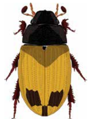
Cercyon littoralis (Hydrophilidé) Dessin L. Picard

fonctionnement des connectivités écologiques, elles sont identifiées dans le cadre des politiques publiques en particulier le Schéma régional de cohérence écologique (Trame verte et bleue). L'IcoCAM constitue aujourd'hui un outil unique et inédit en France. Aux côtés d'autres méthodes scientifiques de suivi, il constitue une opportunité à saisir pour s'assurer de la réussite écologique des opérations qui seront engagées localement en faveur des mares. ■