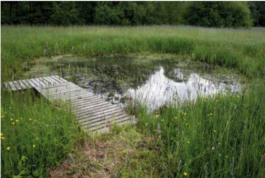
Mare temporaire, en eau au printemps et à sec en automne (Saint-Gervais-du-Perron, Orne)