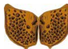
Plaques coxales de Peltodytes (Halipplidé) Dessin F. Picard