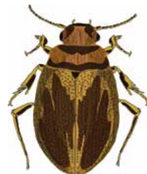
Hygrobia hermani (Paléobiidé) Dessin F. Picard