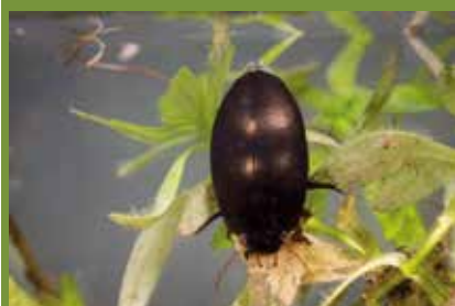
Agabus bipustulatus

de quelques millimètres à plusieurs centimètres, les Dytiscidés sont d'habiles nageurs, prédateurs aux stades larvaire et adulte. Certaines espèces sont extrêmement répandues et ubiquistes (ex : Agabus bipustulatus ), d'autres sont très spécialisées (eaux salées, eaux acides, etc.). ■