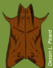
Dessin L. Picard

Les Notéridés, peu nombreux en France (3/2), sont très reconnaissables à leur plaque coxale en forme de « queue d'hirondelle » (face ventrale, dessin ci-dessous). Noterus clavicornis est de loin la plus fréquente des deux espèces et régulièrement trouvée dans différents types de mares.