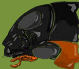
Gyrinus sp. , tête de profil - Dessin L. Picard

Les adultes se déplacent à très grande vitesse à la surface donnant l'impression de petites billes argentées. Ils sont capables de voir simultanément sous la surface et au-dessus de l'eau grâce à la disposition de deux paires d'yeux (cf. dessin). Gyrinus substriatus est la seule espèce de cette famille observée au cours de l'étude (15/1).