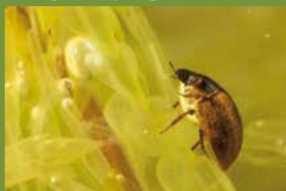
Anacanea lutescens - Cliché F. Nimal

certaines Cercyon sont terrestres et vivent dans les excréments d'animaux ou la matière en décomposition (laises de mer, compost). ■