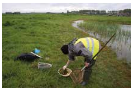
Différentes phases de l'échantillonnage

d'avoir quelques éléments de comparaison, quelques sites hors définition ont été inclus : étangs (prairie de Caen), mares sur écoulement, mare profonde, etc.