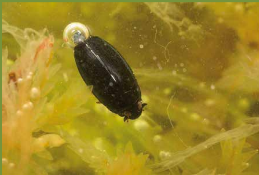
Gyrinus caspius (Gyrinidé)