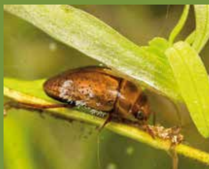
Noterus clavicornis (Notéridé)

La famille des Paléobiidés ou Hygrobidés ne compte qu'une seule espèce en France, Hygrobia hermani . Elle se reconnaît très facilement à sa forme trapue, ovale et convexe et surtout à la stridulation qu'elle émet lorsqu'elle est capturée. C'est une espèce fréquente dans les milieux à fonds vaseux où elle consomme des vers.