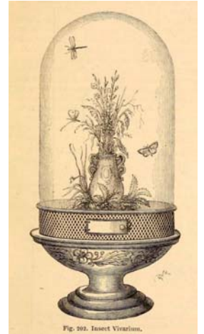
Vivarium à insectes, gravure de 1886.

Ci-dessus, appareil à capturer les insectes sans les blesser. Brevet (américain) déposé en 2003 par Anthony Allen.