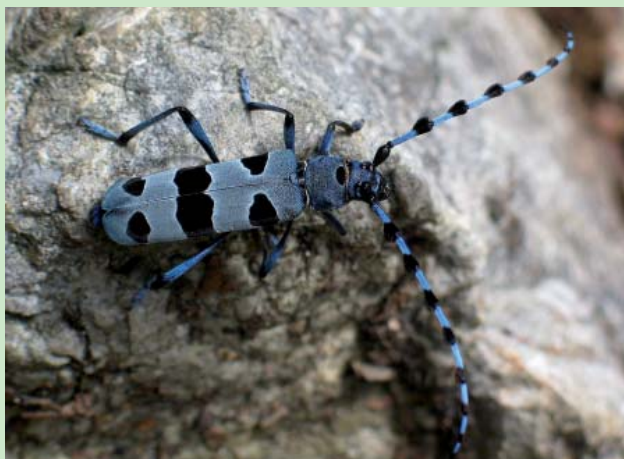
Rosalie des Alpes

De ces 10 espèces, la moitié est peu utilisable pour la conservation : 3 d'entre elles sont extrêmement localisées et méconnues (les Bostrichidés Stephanopachys linearis et S. substriatus , le Carabidé Rhysodes sulcatus ) et la présence actuelle en France est sujette à caution pour Phryganophilus ruficollis (Mélantryd) et Cucujus cinnaberinus (Cucujidé).