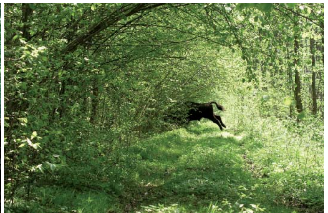
Ci-dessus, vieille forêt en Roumanie. À droite, bison surpris en forêt primaire de la Bialowieza (Pologne)