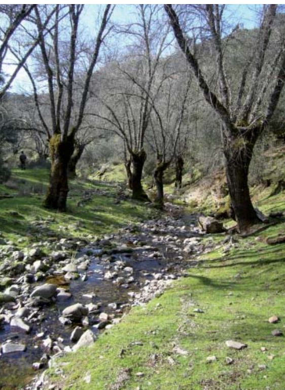
Ripisylves à têtards de frênes en Espagne Cliché Hervé Brustel