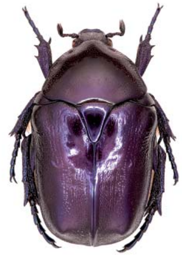
Grande Cétoine bleue - Cliché Pierre Zagatti

exigeants en vieux bois. Les Coléoptères répondent très bien aux opérations récentes de restauration (bois brûlés, coupes abandonnées ça et là, îlots non exploités, coupes en souches hautes) et à un réseau lâche mais largement réparti de vieilles forêts en réserve. Des espèces très rares considérées au bord de l'extinction ( Cucujus cinnaberinus , Tragosoma depsarium , Stephanopachys spp., etc.) recolonisent massivement ces espaces. En zone méditerranéenne, on doit au vin, à la corrida et au jambon de belota une situation originale