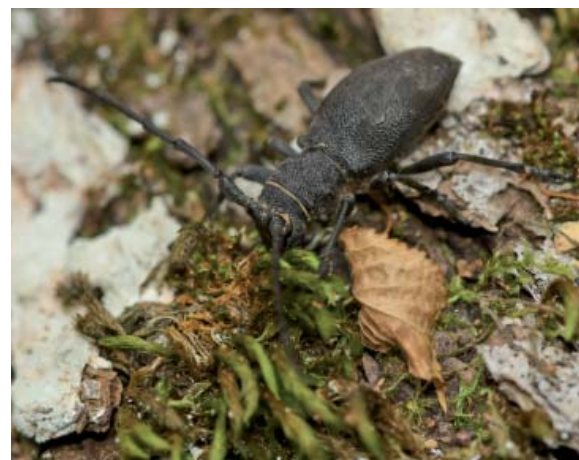
Morime rugueux sur sol forestier

morts mais qui n'est pas regardant sur l'essence et est très endurant à la marche. Certains charançons des genres Acalles et proches, liés aux branches mortes, peu mobiles, peuvent survivre sur des brindilles de bruyère dans des landes secondaires ayant remplacé leurs forêts d'origine. Par contre, d'autres espèces ( A. camelus , A. echinatus ou A. fallax et Ruteria hypocrita ) font figure de « fantômes du passé » dans les sites anciens où ils restent présents. Quand ces Coléoptères sont à la fois exigeants et peu mobiles, leurs populations sont en danger ; c'est le cas de quelques genres saproxyliques riches en endémiques comme par exemple les Colydiidés du genre Tarphius , ça et là signalés du sud-ouest du Bassin méditerranéen et particulièrement diversifiés dans les îles Atlantiques au sein des laurisylves, formations forestières héritées de l'aire tertiaire.