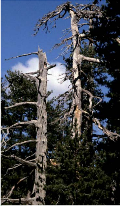
Vieille forêt des Pyrénées