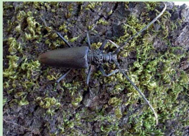
Grand Capricorne

Ces éléments auxquels s'ajoute la relative facilité de leur détection directe ou indirecte (trous de Grand Capricorne, crottes du Pique-prune) permettent d'utiliser ces espèces ensemble pour mettre en évidence la qualité de la forêt de plaine telle qu'elle est ou ses besoins de restauration. Par contre, la protection stricte du Grand Capricorne est malheureusement inadaptée : c'est un insecte commun et localement abondant au sud de la France et il faut considérer bien d'autres espèces de Coléoptères que celles présentes dans les listes d'espèces protégées pour repérer, en vue de leur conservation, tous les types de vieilles forêts. ■