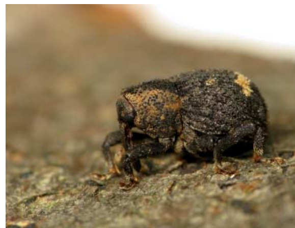
Le charançon Ruteria hypocrita en forêt de Fontainebleau