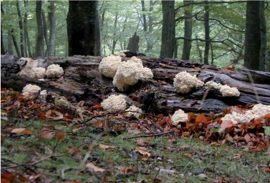
Champignons Hericium sur bois mort de hêtre dans une vieille forêt des Pyrénées dans la réserve naturelle nationale de la Massane

turalité originelle qui est en particulier caractérisé par le retour de processus sylvigénétiques 1 originaux, rares en forêt exploitée : apparition dans le couvert de phases de dégradation (ou d'effondrement) et de phases d'innovation 2 qui génèrent de grandes proportions de bois morts. Il en résulte une mosaïque instable et complexe de stades forestiers (clairières, fourrés, jeunes peuplements, grands arbres, etc.) variés permettant d'assurer l'existence de très nombreuses espèces animales et végétales, quelles que soient leurs exigences écologiques. Parmi les groupes taxinomiques les plus favorisés, on peut citer notamment les oiseaux, les insectes (en particulier les Coléoptères saproxyliques), les champignons, les chiroptères et autres petits mammifères. Parmi tous les milieux naturels, c'est dans les vieilles forêts que la diversité biologique est la plus importante, permettant de les considérer comme des écosystèmes exceptionnels.