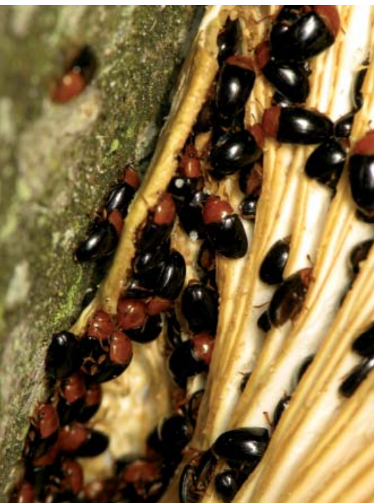
Triplax sp. se nourrissant de pleurotes en forêt de Fontainebleau

pra rutilans , (Buprestidé), Saperda octopunctata , Oplosia fennica et Stenostola spp. (Cerambycides), Isorhipis marmottani (Eucnemidé). Au même titre que les phytophages primaires (qui attaquent les arbres sains), ces espèces liées à des essences toujours inégalement distribuées semblent relativement mobiles et capables de réagir favorablement à l'offre massive de ressources suite à une trouée liée à une tempête par exemple, à condition bien entendu que des zones refuges existent aux environs (à quelques kilomètres).