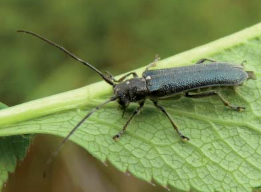
Stenostola dubia dont les larves se développent sur tilleul