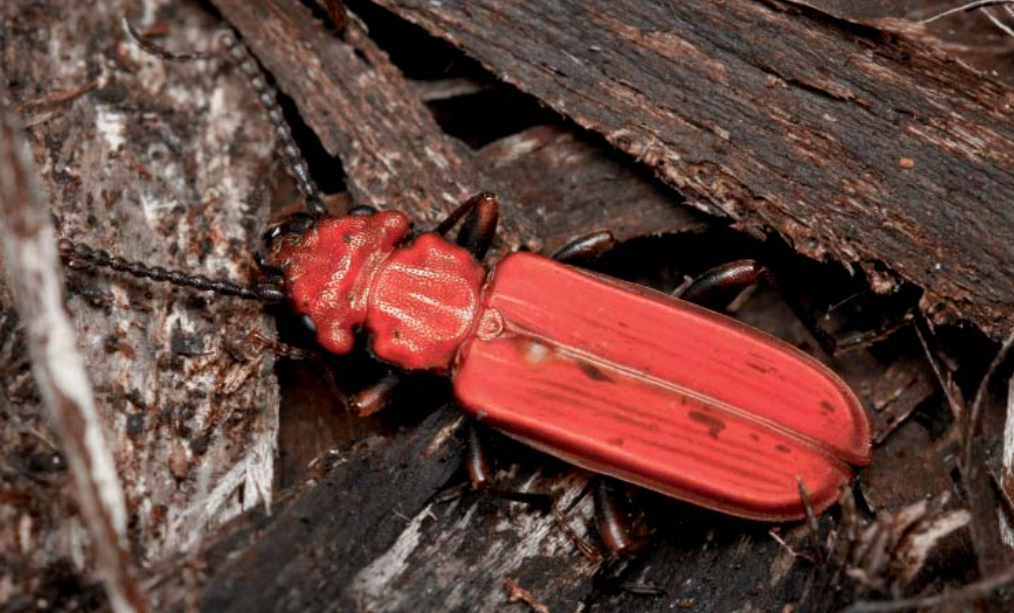
Cucujus cinnaberinus - © Nicolas Gouix et Hervé Brustel