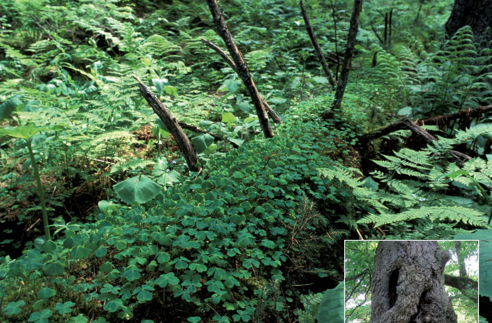
Arbre tombé au sol et envahi par la végétation dans une vieille forêt de Roumanie Ci-contre, vieux chêne à cavité en zone pastorale du Pays basque