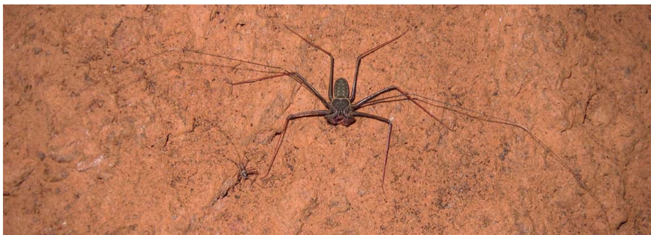
Heterophrynus longicornis (Phrynidé). Ce juvénile n'a pas encore acquis toutes les couleurs de l'adulte, notamment les zones rouge brique sur les pédipalpes et le corps, qui lui assureront un meilleur camouflage.

se positionne face à lui et le tapote à son tour. Le mâle continue de faire vibrer ses pattes antenniformes à très grande fréquence (à tel point qu'on ne les distingue pratiquement plus à l'œil nu) puis il émet un spermatophore qu'il dépose sur le sol. En touchant la femelle du bout de ses pattes antenniformes, il la guide au-dessus du spermatophore. Elle récupère alors le sperme et le couple se sépare. Quelques mois après l'accouplement, la femelle pondra entre 20 et 50 œufs qui resteront attachés sous l'opisthosome pendant plusieurs mois.