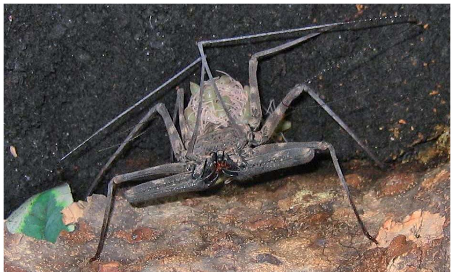
À gauche, femelle de Euphrynichus bacillifer avec sa ponte. À la naissance, les jeunes gagnent le dessus de l'abdomen (à droite, Damon sp.).