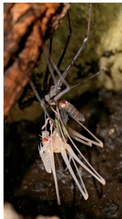
H. longicornis effectuant sa mue

Le camouflage est essentiel à la défense des Amblypyges et à la capture de leurs proies. Leurs colorations généralement assez sombres sont adaptées à un environnement dépourvu de lumière, variant du brun à un rouge latéritique, mais on trouve également des couleurs plus claires, tirant sur le beige. S'ils se sentent menacés, ils s'aplatissent contre la paroi laissant ainsi moins de prise à l'œil comme à un prédateur possible. En cas de danger réel, ils préféreront prendre la fuite. Toutefois, certains individus feront face (s'ils sont déjà stressés), écartant leurs pédipalpes, prêts à attaquer leur agresseur. ■