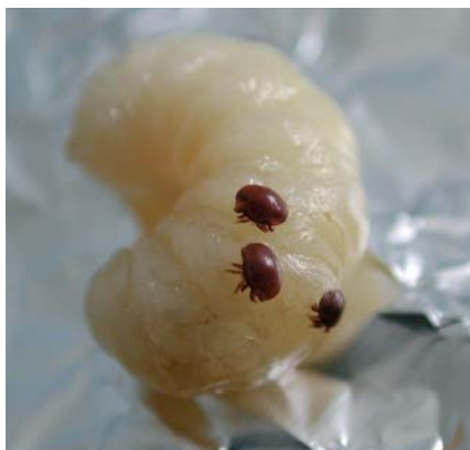
Varroas sur une larve d'abeille

Les pesticides ont représenté un progrès dans la maîtrise des res-