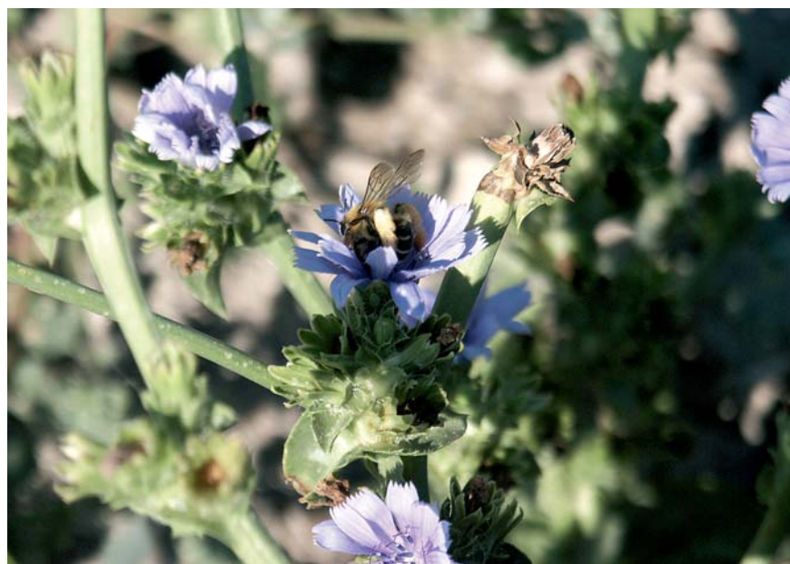
Abeille solitaire ( Dasygaster hirtipes , Mellitidés) en train de butiner sur une fleur de scarole en culture porte-graine pour la production de semence.

En janvier 1999, en vertu du principe de précaution, le ministère de