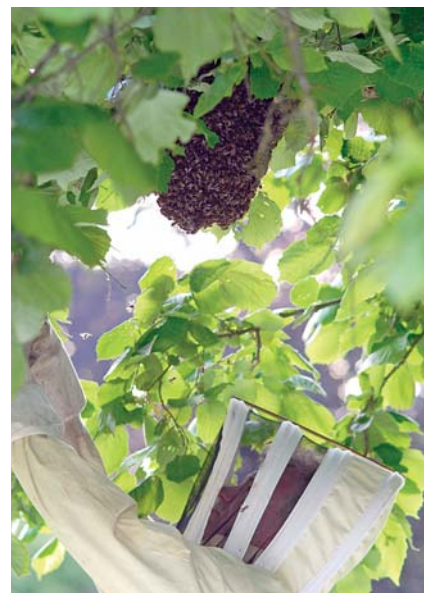
Récolte d'un essaim par un apiculteur amateur

sources alimentaires. Parmi les plantes qui ont ainsi un besoin vital des insectes pollinisateurs se trouvent des plantes sauvages ainsi que des plantes cultivées. Les cultures entomophiles, c'est-à-dire qui ont besoin de ces insectes pollinisateurs, se composent des arbres fruitiers (pommiers, cerisiers, etc.), des arbustes "à petits fruits" (fraisiers, framboisiers, etc.), des légumes (tomates, etc.), des oléagineux (colza, tournesol) et des productions fourragères (luzerne, trèfles, etc.). De ce