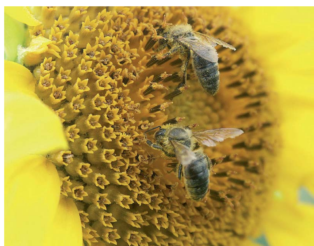
La production de miel de tournesol a été une des premières touchées par la mortalité des Abeilles

l'Europe. Les insectes pollinisateurs sont donc indispensables en agriculture, comme à la préservation de la biodiversité florale des prairies.