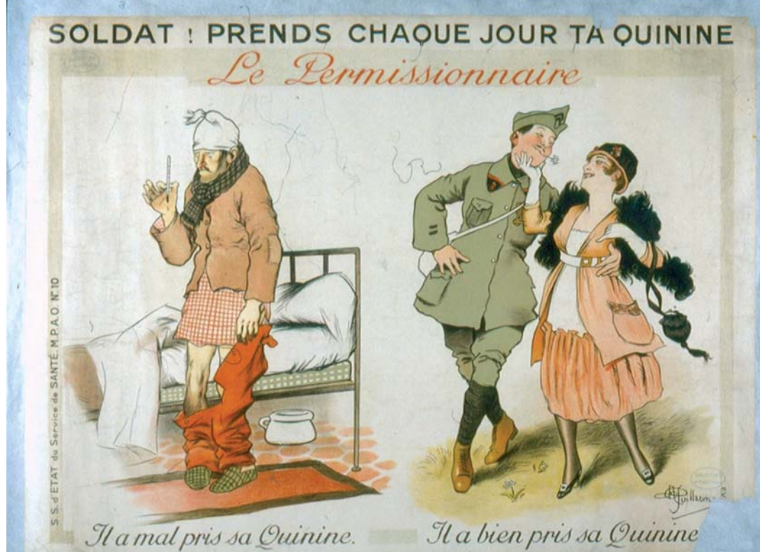
Le péril entomologique est un souci de longue date pour les armées. "Soldat : prends chaque jour ta quinine" – Affiche de la campagne de prévention contre le paludisme pendant la Première Guerre mondiale, vers 1915-1920.