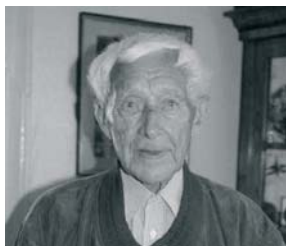
Ernst Jünger