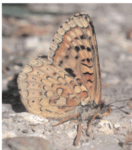
Mâle au repos, ailes fermées

L'espèce, protégée sur le territoire français en raison de la rareté et de l'isolement de ses populations, est inscrite à l'arrêté national du 22 juillet 1993 (JORF du 24/09/1993).