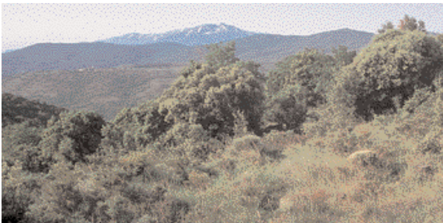
Zone de reproduction du Damier des knauties dans les Pyrénées-Orientales avec, en arrière plan, le massif du Canigou

Ce papillon fréquente des milieux (habitats) chauds et secs : prairies fleuries et buissonneuses, friches sèches, vallons rocheux et abords de cultures de 50 à 2 800 m sui-