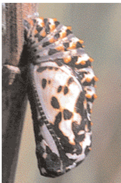
Chrysalide du Damier des knauties