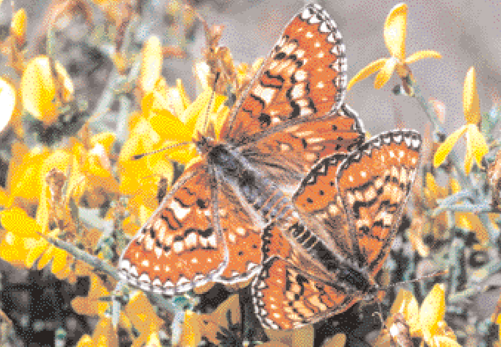
Accouplement (le mâle est à droite)

vant les localités. En France on le rencontre entre 500 et 800 m d'altitude où il vole aux heures chaudes et butine principalement les fleurs de thym.