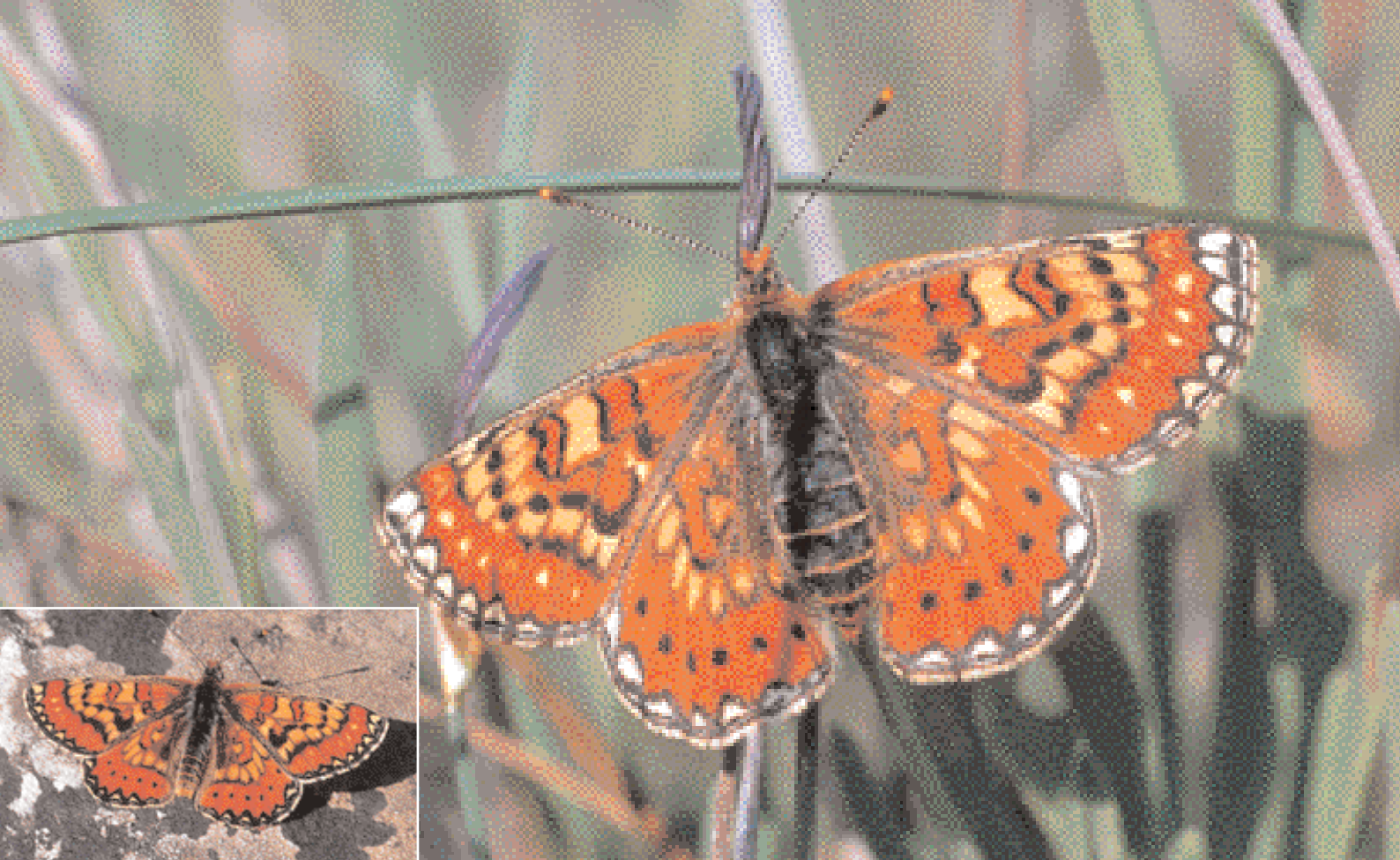
Le mâle du Damier des knauties