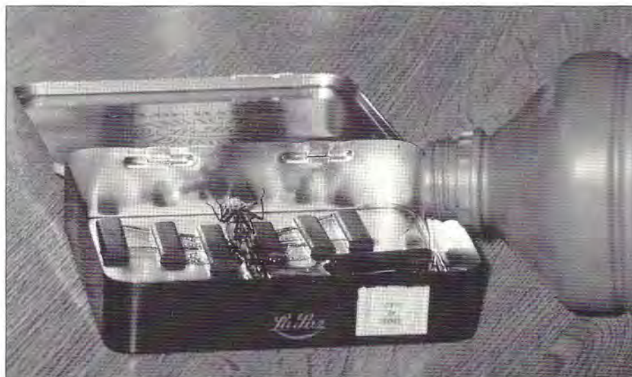
Traitement des couleurs. La libellule morte est étalée dans la boîte métallique à l'aide des aimants puis immergée dans l'acétone. (Cliché J.L. Dommanget - SFO - OPIE).

Si l'identification a été faite, une deuxième étiquette de format identique à la précédente sera réalisée avec le nom complet (genre, espèce, auteur, année de description), le sexe du spécimen en question et le nom du déterminateur suivi de l'année de l'identification.