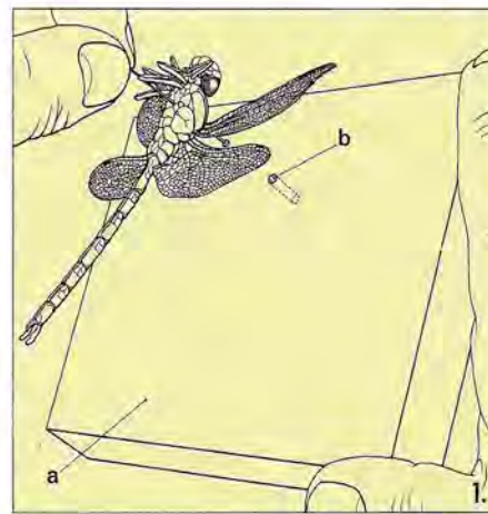
Fig 1a. Plaque de polystyrène (3 cm d'épaisseur) Fig. 1b. Orifice permettant le logement de la tête d'épingle.

Toutes les autres espèces doivent être traitées.