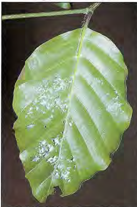
■ Phyllaphis fagi édifie ses colonies à la face inférieure des feuilles

Quant au Phytopte de l'Erinose, Eriophyes nervisequus fagineus , considéré comme sous-espèce de la précédente, il vit à la face inférieure des feuilles dans les espaces internervaires, provoquant la formation de nombreux poils hypertrophiés, claviformes, de couleur claire, mais qui, en automne, prennent une coloration rouge violacé, avant de brunir. Tous ces acariens hivernent, abrités sous les écailles des bourgeons.