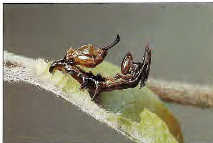
■ Stauropus fagi est un papillon mimétique spécifique du Hêtre dont la chenille, que voici, a des caractéristiques tout à fait originales

La Hachette, Agria tau , est une espèce non moins curieuse. Les papillons mâles ont une couleur brun fauve, la femelle est nettement plus grande et sa couleur est pâle. Les ocelles bleu-violacé, entourées de noir, sont marquées d'une pupille blanche en forme de T ou de hachette. Curieusement la femelle est nocturne alors que le mâle vole le jour en avril-mai. Au repos les ailes sont dressées comme celles des Rhopalocères. Les œufs sont déposés sur les rameaux.