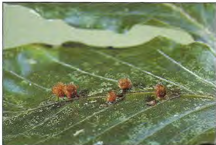
■ Ces minuscules galles des feuilles sont provoquées par Hartigiola annulipes . La piqûre effectuée lors de la ponte est l'origine d'une galle dans laquelle se développe la larve

sous l'écorce, dans le sol ou sous un abri quelconque. Il reprend son activité dès le début de la feuillaison. Il se nourrit en perforant les feuilles de multiples trous de 1 mm de diamètre environ. La femelle insère chacun de ses 30 à 35 œufs dans la nervure principale, face inférieure des feuilles. De mai à juin, chaque larve creusera une mine qui s'élargit progressivement en gagnant l'extrémité de la feuille. Celle-ci brunit et peut faire penser à l'effet d'une gelée printanière du limbe. La nymphose a lieu dans la mine. Les nouveaux adultes sortent fin juin, s'alimentent puis estivent en juillet et hivernent.