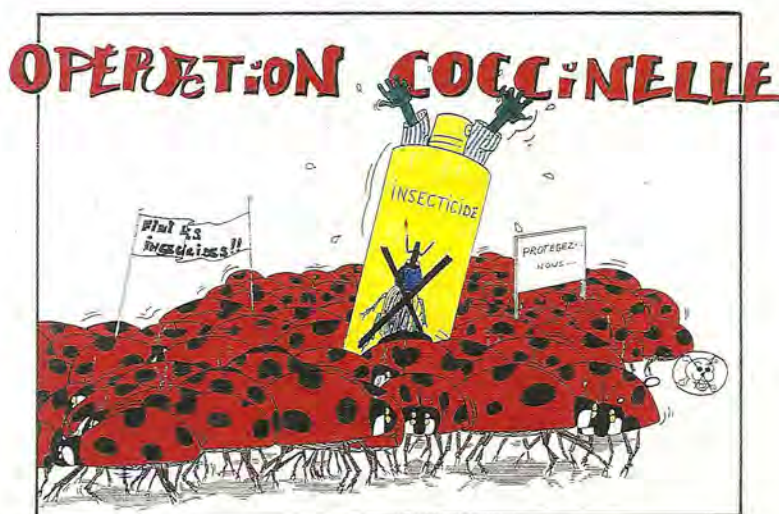
"L'opération coccinelles" vue par un élève

Le niveau de consommation des sources d'énergie, des matières premières, de l'eau, est tel que les prévisions, à moyen terme, des scientifiques sont alarmantes. La destruction des forêts des régions tropicales prend des proportions démesurées. Et même sans aller aussi loin... dans le Sud de la France, la destruction annuelle des forêts bouleverse complètement les conditions écologiques du milieu. A ceci, on peut ajouter la pollution des eaux douces et des nappes phréatiques par les nitrates provenant de l'utilisation des fertilisants, devenue chose commune dans de nombreuses régions françaises.