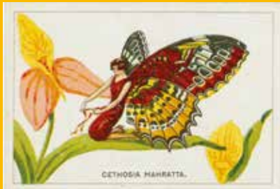
La femme-papillon du trimestre : Cethosia mahratta