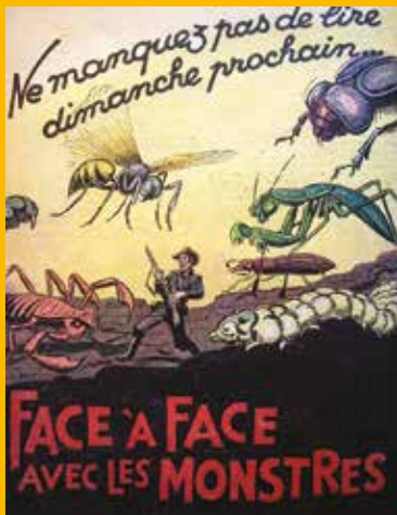
Face à face avec les monstres par Henri Darblin (1937)

Au Moyen Âge, le pou était appelé pouil (qui donne les formes : pouilleux, pouiller) ... tout comme le coq. C'était donc à l'origine le fier volatile qui était évoqué dans cette expression. L'homonymie a amené la confusion, à moins qu'elle n'ait été volontaire, par dérision.