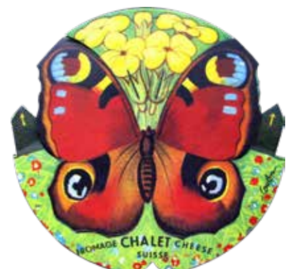
Étiquettes d'emballage pour une marque suisse de fromage