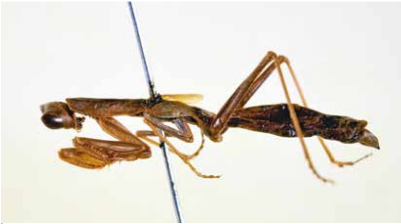
Spécimen de femelle de P. brevipennis conservé au Muséum d'histoire naturelle de Genève