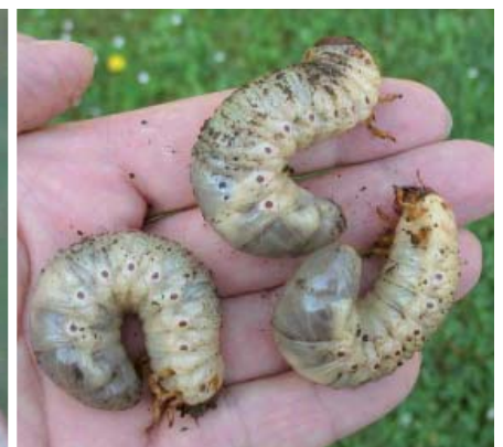
Œufs et larves de face et de profil. Celles-ci atteignent 6 cm à maturité.