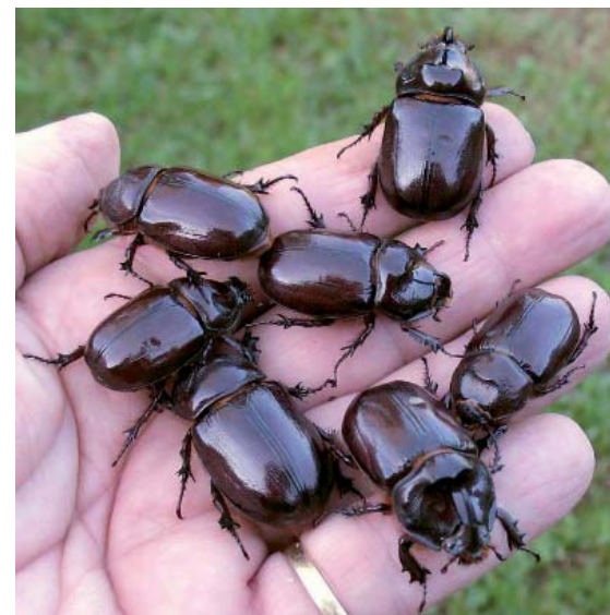
Les Rhinocéros de mon compost.