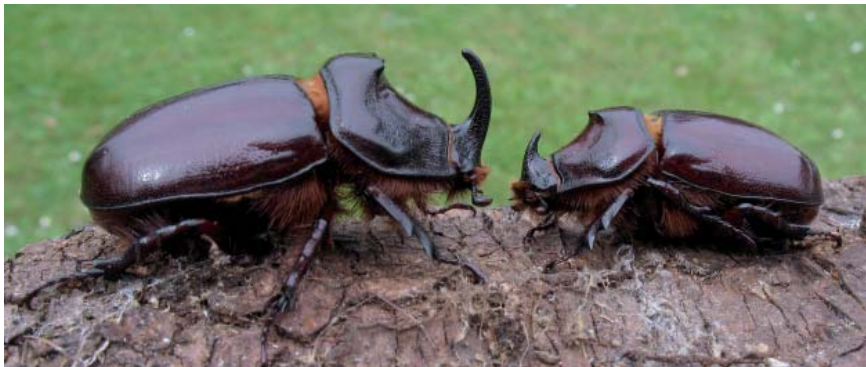
Chez ces insectes comme chez le Lucane Cerf-volant, les tailles varient beaucoup entre de plus grands individus dits « major » (ici à gauche) et les « minor » (à droite), avec des intermédiaires variés (« medium »).

qui peut laisser supposer une durée de vie imaginaire assez longue, bien que l'adulte puisse se passer de nourriture. Mes observations semblent montrer qu'il est très casanier et fidèle à son lieu de naissance, car sur certain site, je l'ai toujours trouvé en un seul point, en dépit de la proximité de plusieurs biotopes très comparables.