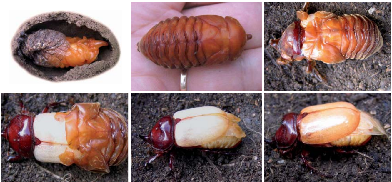
De gauche à droite et de haut en bas : loge nymphale disséquée ; nymphe en vue dorsale ; étapes de la mue imaginale.