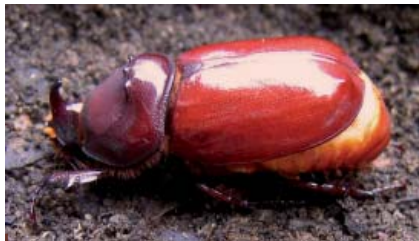
La mélanisation est pratiquement terminée au bout de 22 heures.

En élevage, arrivé au stade larvaire normalement atteint à l'approche de l'hiver et ce, quelles que soient les conditions ambiantes, notre grillon perd de son activité, et cesse de s'alimenter durant une quarantaine de jours. Au-delà de ce cap il reprend une activité normale qui à terme le mène au stade d'adulte.