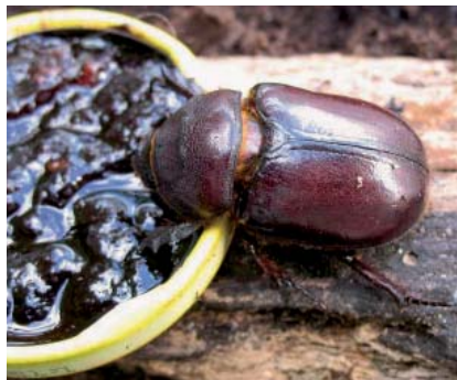
Le Rhinocéros adulte passe pour ne pas s'alimenter mais, en élevage, la pondreuse ci-dessus a été surprise à manger « en douce » à plusieurs reprises.

La larve, de type mélolonthoïde, est arquée comme le Ver blanc (Hanneton commun Melolontha melolontha ). En principe elle est