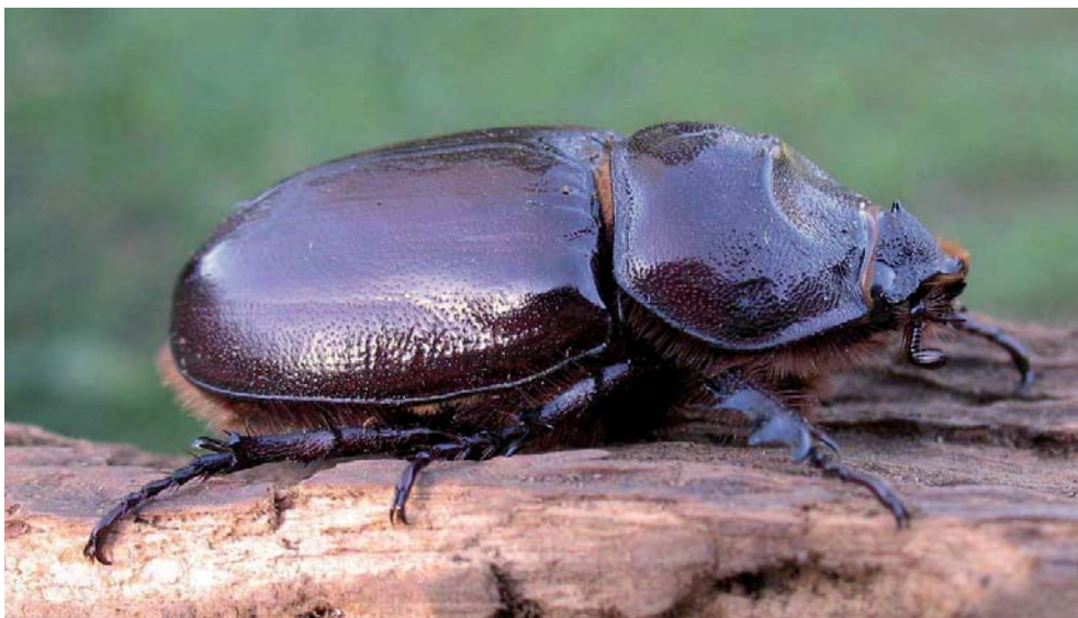
Mâle (en haut) et femelle du Rhinocéros.