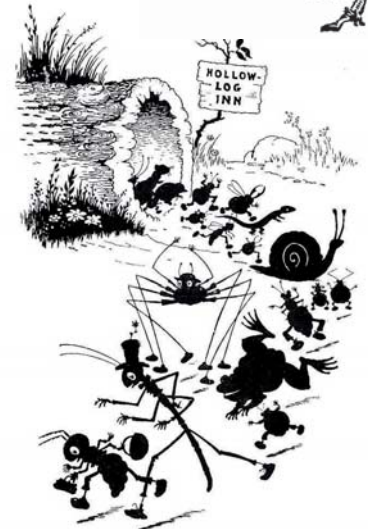
Stepping as carefully as they could, out marched the whole company from Hollow-Log Inn

Alphonse de Lamartine extrait de « L'Homme », poème dédié à Lord Byron in Méditations poétiques , 1820