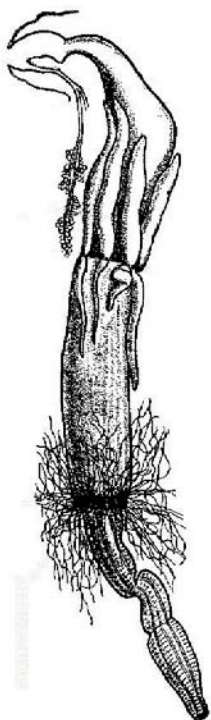
Appareil digestif d'une sauterelle