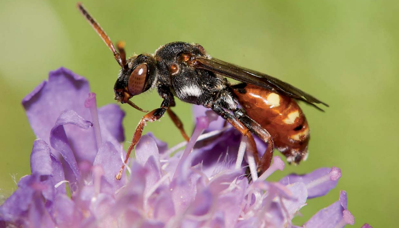
Femelle de l'abeille coucou Nomada armata