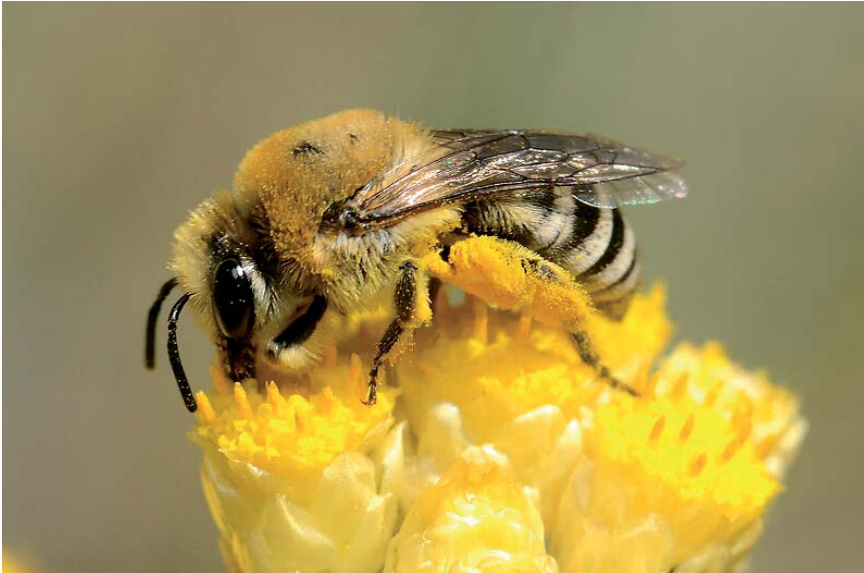
Une femelle de Colletes abeille , espèce méditerranéenne spécialisée sur Helychrisum pour la récolte du pollen, présente dans la partie méridionale du Mercantour