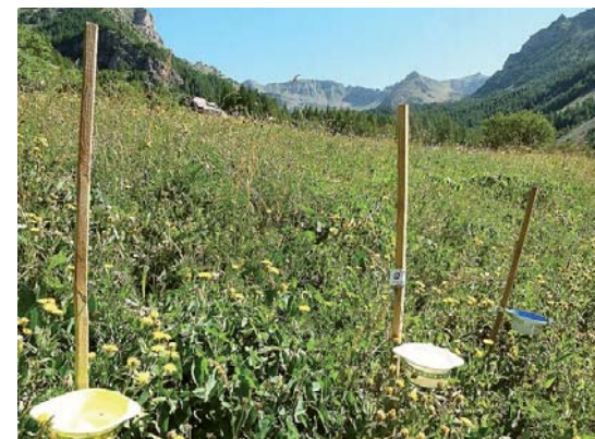
Une des stations de piégeage dans une prairie de fauche du parc avec ses coupelles de trois couleurs

Les abeilles sauvages ont pour nombre d'entre elles des exigences assez strictes et leur présence