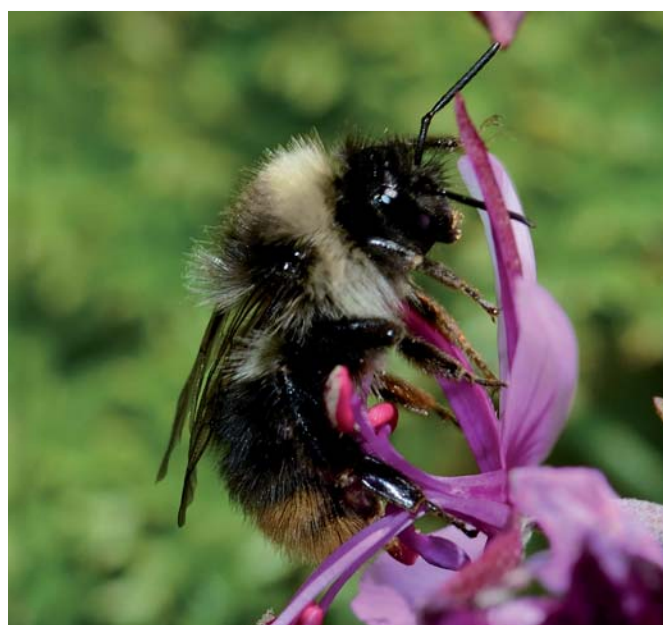
Une ouvrière de Bombus pyrenaeus , bourdon caractéristique des montagnes du Sud de l'Europe