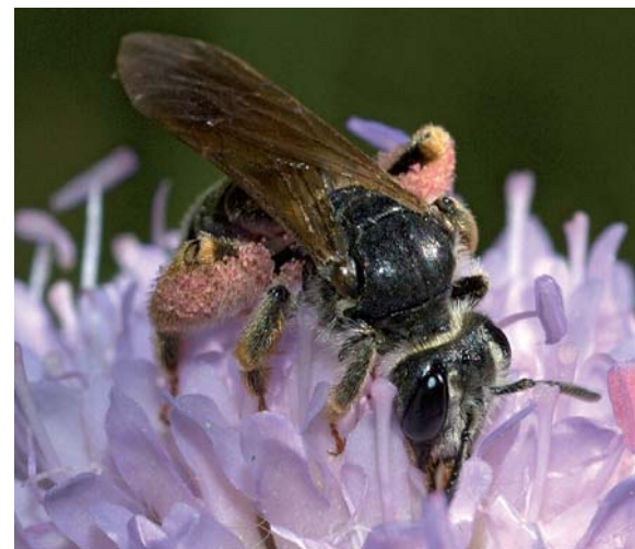
Une femelle d' Andrena hattorfiana , hôte exclusif de Nomada armata

campagnes d'inventaire en juillet 2009 et 2010 (Schmid-Egger, 2011). Sur 19 sites répartis dans le parc, il a mené des chasses à vue au filet de façon semi-aléatoire (sans parcours strictement défini mais en privilégiant certains milieux jugés