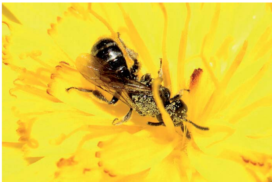
Femelle de Dufourea alpina , taxon rare des montagnes du Sud de l'Europe, qui se trouve dans certaines pelouses alpines du parc

Nomada armata est strictement liée à Andrena hattorfiana , l'Andrène des scabieuses. Cette espèce alimente ses larves uniquement avec du pollen de Dipsacacées de type Scabiosa qu'elle stocke, mélangé avec du nectar, dans de petites cellules creusées dans le sol où elle pond ses œufs et où se développent les larves. N. armata va pondre dans les cellules en cours d'approvisionnement par l'Andrène des