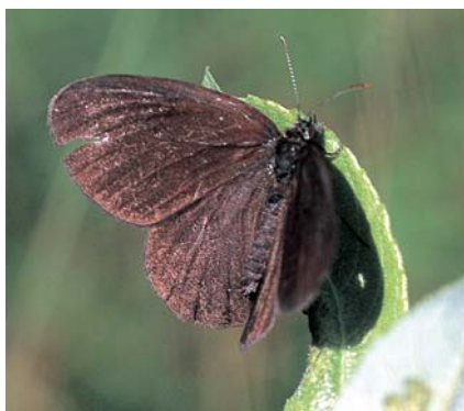
Le mâle du Fadet des laïches, ailes ouvertes.

conservation est très forte. La région Aquitaine renferme les plus importantes populations de l'Ouest de l'Europe : notre pays et cette région en particulier ont donc une forte responsabilité patrimoniale vis-à-vis de cette espèce.