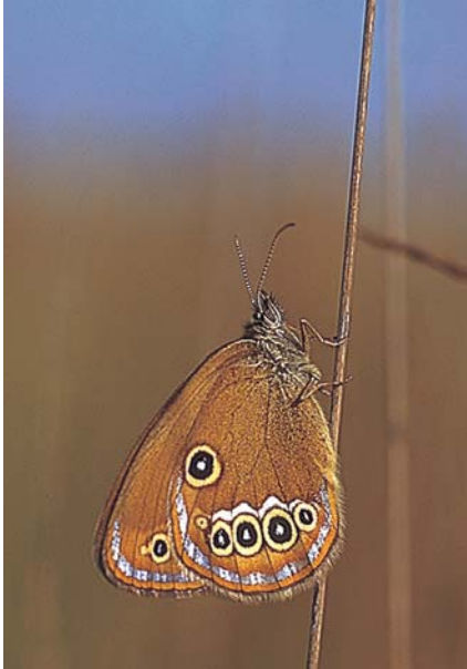
Femelle du Fadet des laïches.

Ce papillon est un hôte des zones humides (il vit aussi en pelouses xérophiles en Italie et Slovénie). Il fréquente les bas-marais, les prairies marécageuses, les landes tourbeuses, les bords des lacs et des étangs. On le rencontre également dans les bois clairs et les forêts bordant ces différents biotopes. Le Fadet des laïches ne dépasse pas 300 mètres d'altitude et vole de fin mai à septembre selon les sites et les années en une seule génération. Les adultes passent la nuit dans les hautes touffes denses de laïches (carex) et d'autres graminées (canches, brachypodes...). Dans la journée les mâles, plus actifs, s'éloignent parfois de leurs