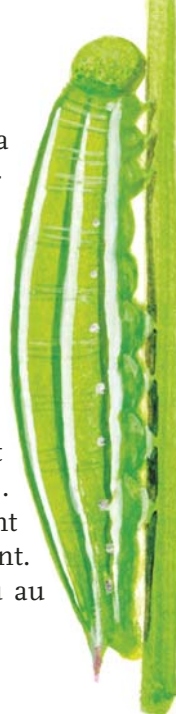
La chenille du Fadet des laïches. Dessin J. Lafranchis

milieux habituels à la recherche des femelles. Les œufs sont pondus isolément sur les plantes-hôtes des chenilles : la canche bleue et le choin noirâtre ( Molinia caerulea et Shoenus nigricans ). Les chenilles naissent en été puis hivernent. La nymphose a lieu au mois de juin.