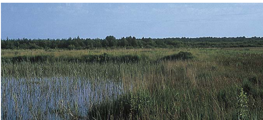
Biotope du Fadet des laïches dans la forêt landaise, aux environs de Lacanau (Gironde).

En France, on trouve cette espèce en région Rhône-Alpes et dans le Sud-Ouest. Dans le domaine atlantique, elle était encore présente il y a une vingtaine d'années dans les régions Île-de-France, Centre et Pays-de-Loire mais elle y est actuellement considérée comme éteinte.