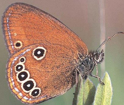
Le mâle du Fadet des laïches au repos.