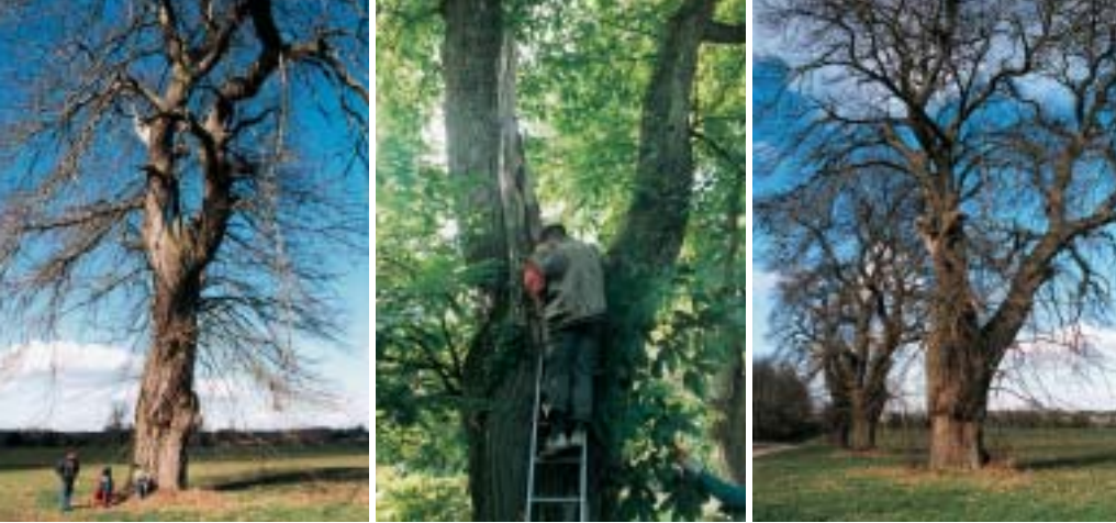
Un des habitats remarquables du Pique-prune : les châtaigniers greffés, véritables cathédrales végétales.