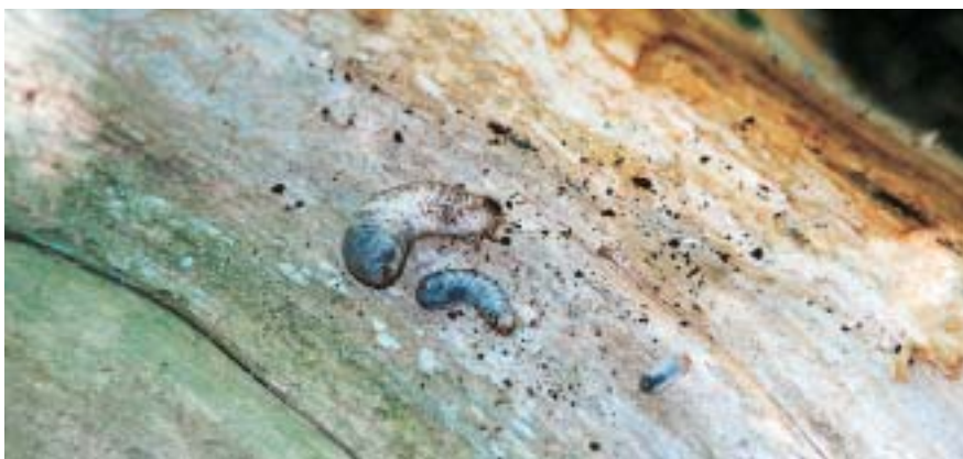
Larves aux stades L1, L2 et L3 d' Osmoderma eremita